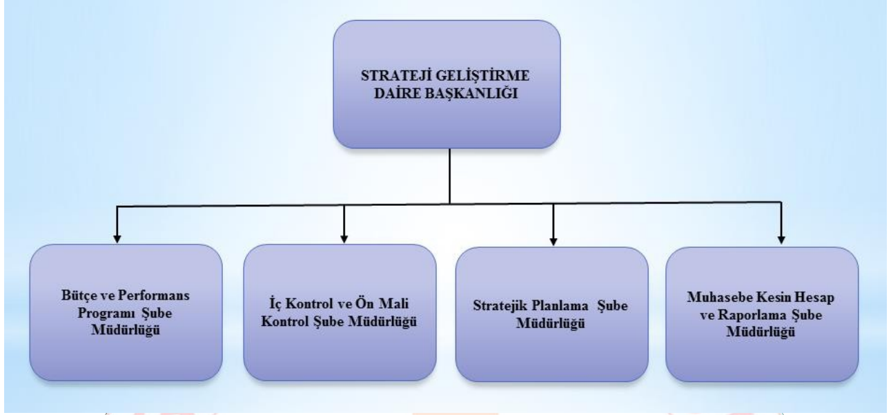
Şekil 1. Başkanlığımız Örgüt Yapısı

Başkanlığımızın örgüt yapısına ilişkin şema aşağıda yer almaktadır;