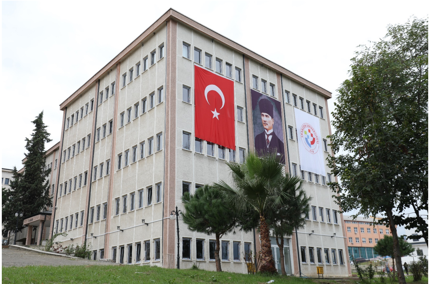
Resim 3. Kampüs İçi Bir Bölüm