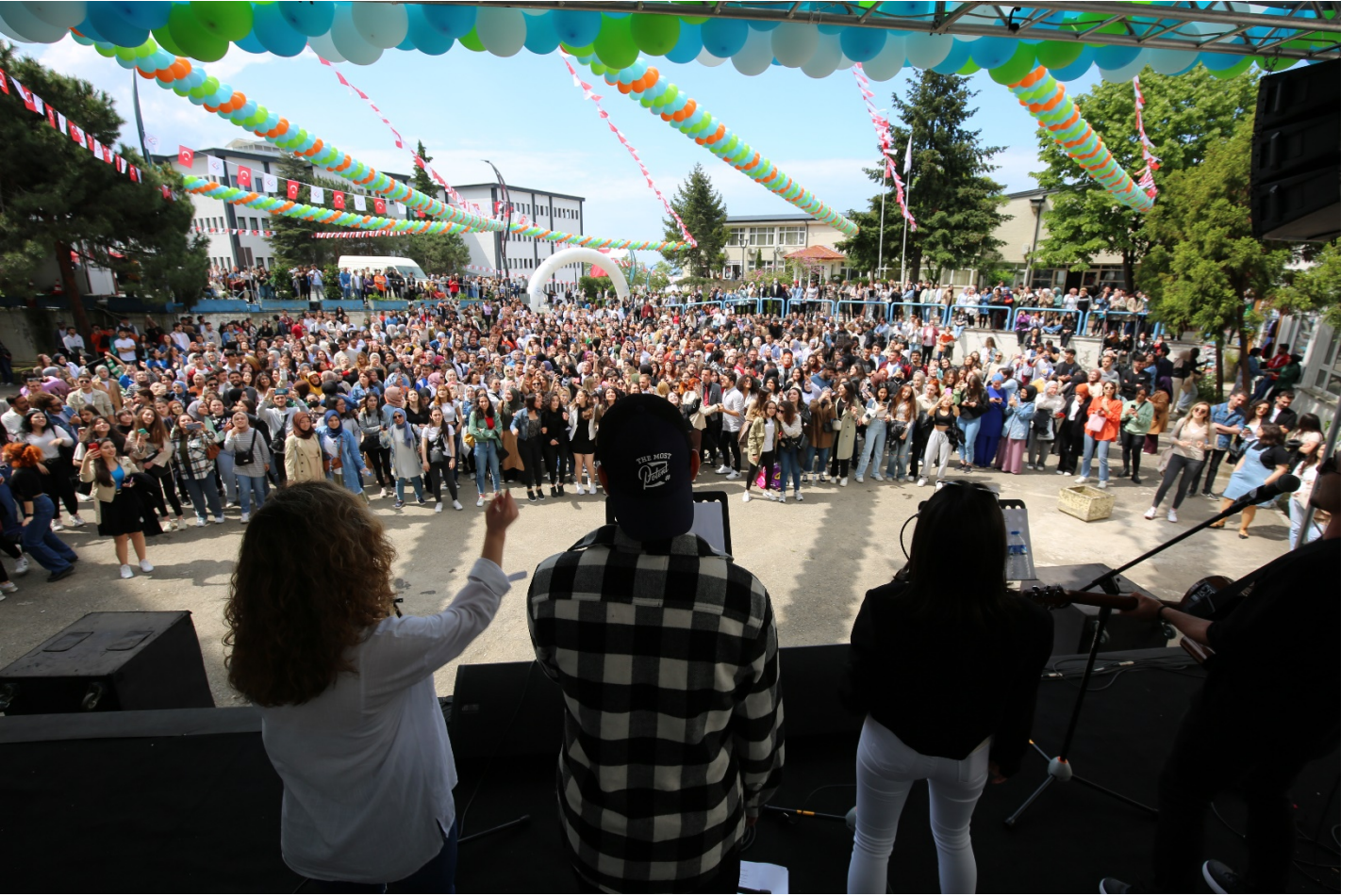
Resim 10: Bahar Şenlikleri Etkinliği