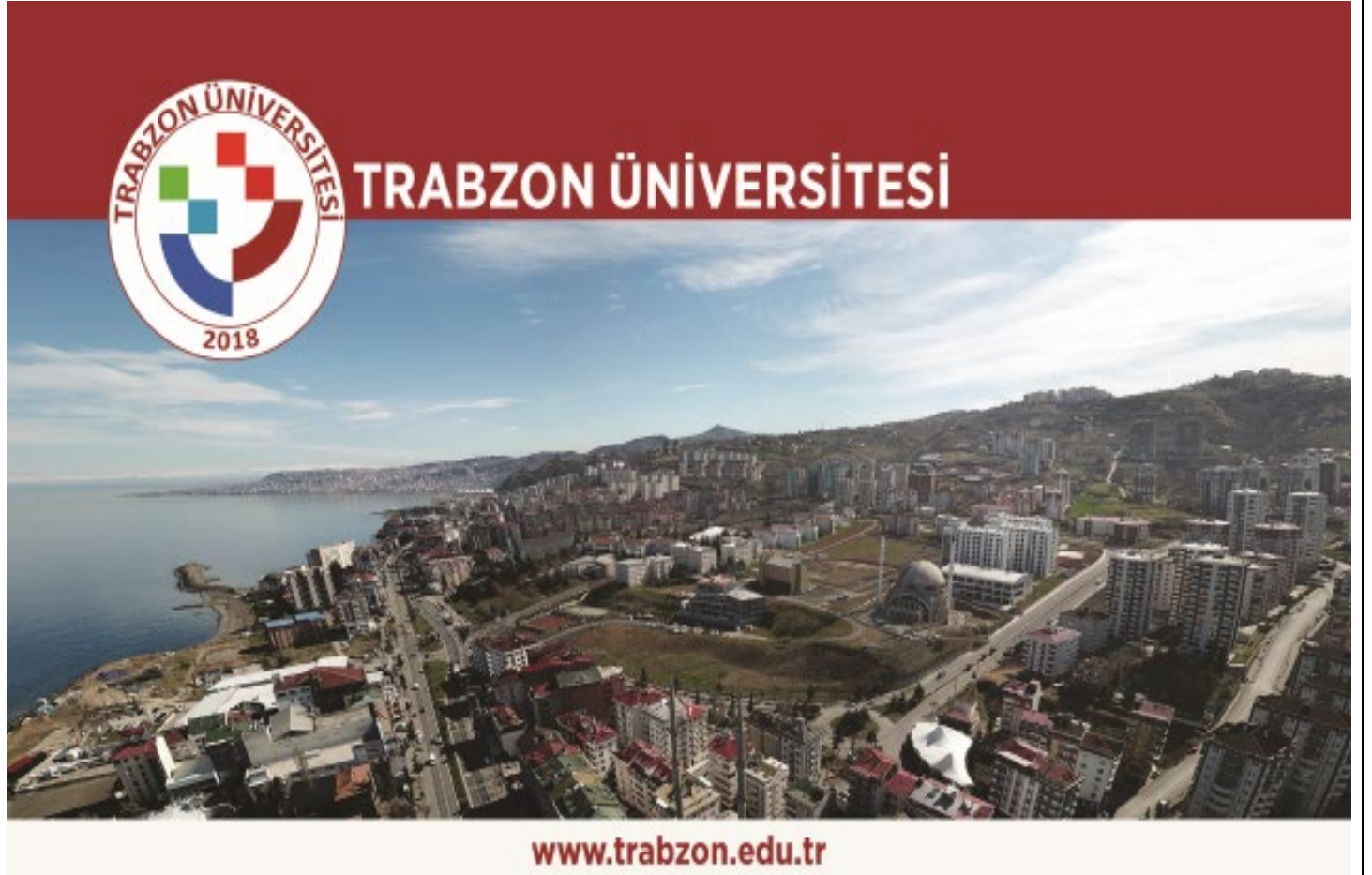
Resim 2. Fatih Yerleşkesi