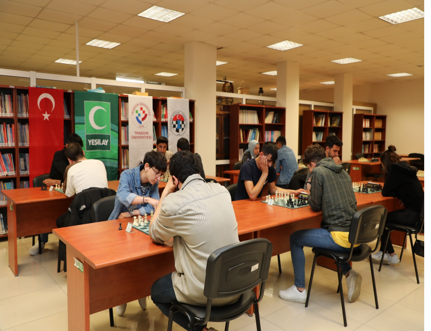
Resim 13 : Üniversitemizde Düzenlenen Satranç Turnuvasından Bir Görünüm