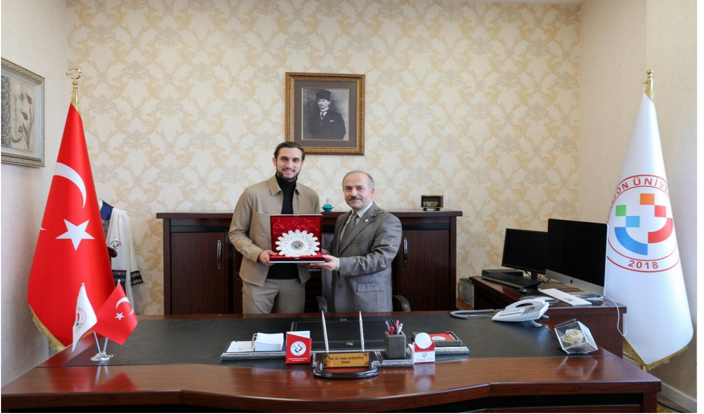
Resim 13 : Milli Futbolumuz YUSUF YAZICI' dan Rektörümüze ziyaret.