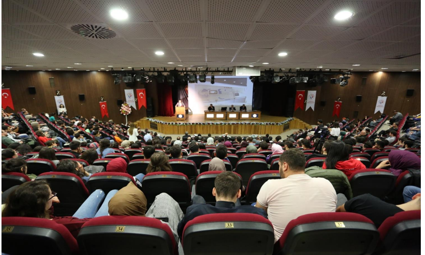
Resim 5- Trabzon Üniversitesi Toplantı Salonu