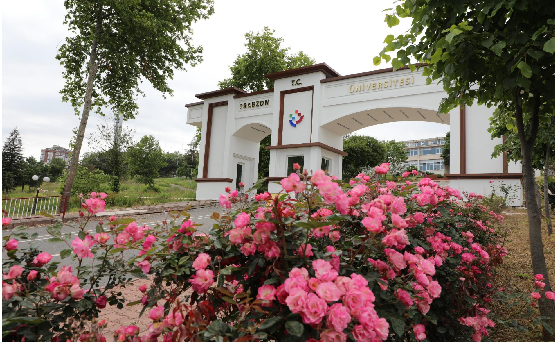
Resim 1 : Trabzon Üniversitesi Girişi