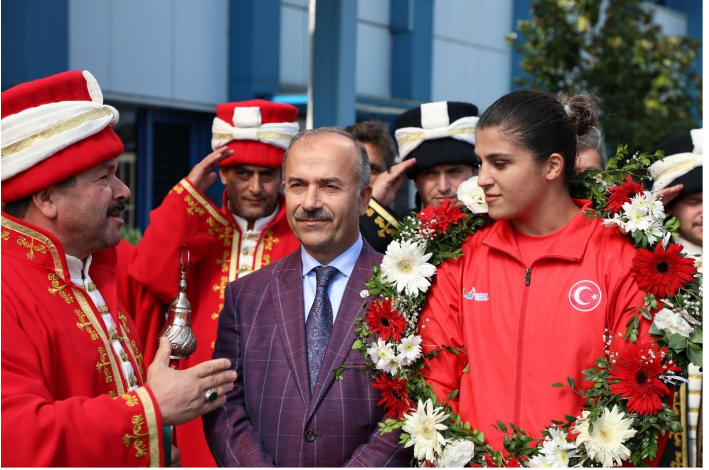
Resim 12 : Dünya Şampiyonu Sporcumuz Busenaz SÜRME NELİ' yi Karşılama Töreni

Dünya Şampiyonu Milli Sporcumuz Busenaz SÜRME NELİ 2020 Tokyo Olimpiyat Oyunlarında boksta kadınlar 69 kiloda altın Madalya Kazanarak tarihe geçmiştir.