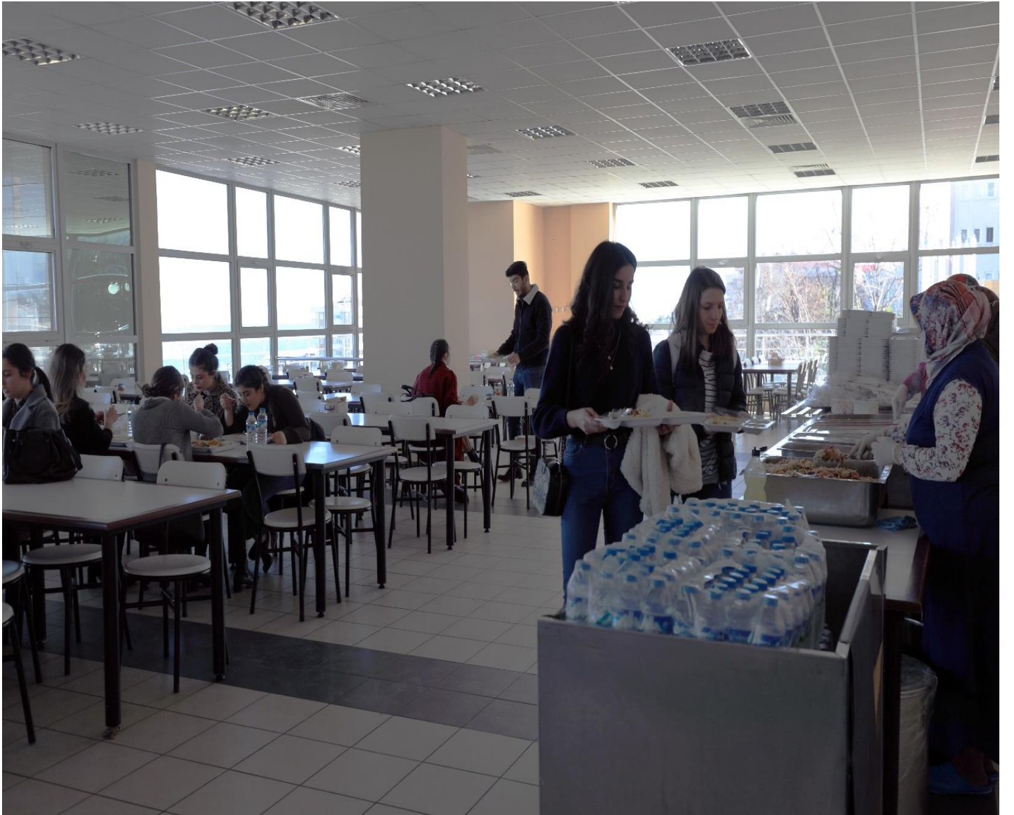
Resim 4: Trabzon Üniversitesi Yemekhanesi