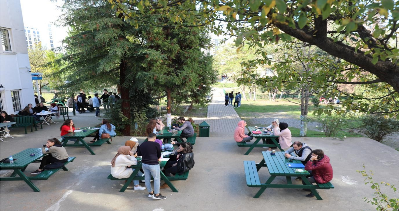
Resim 7: Öğrenci Kantini 1