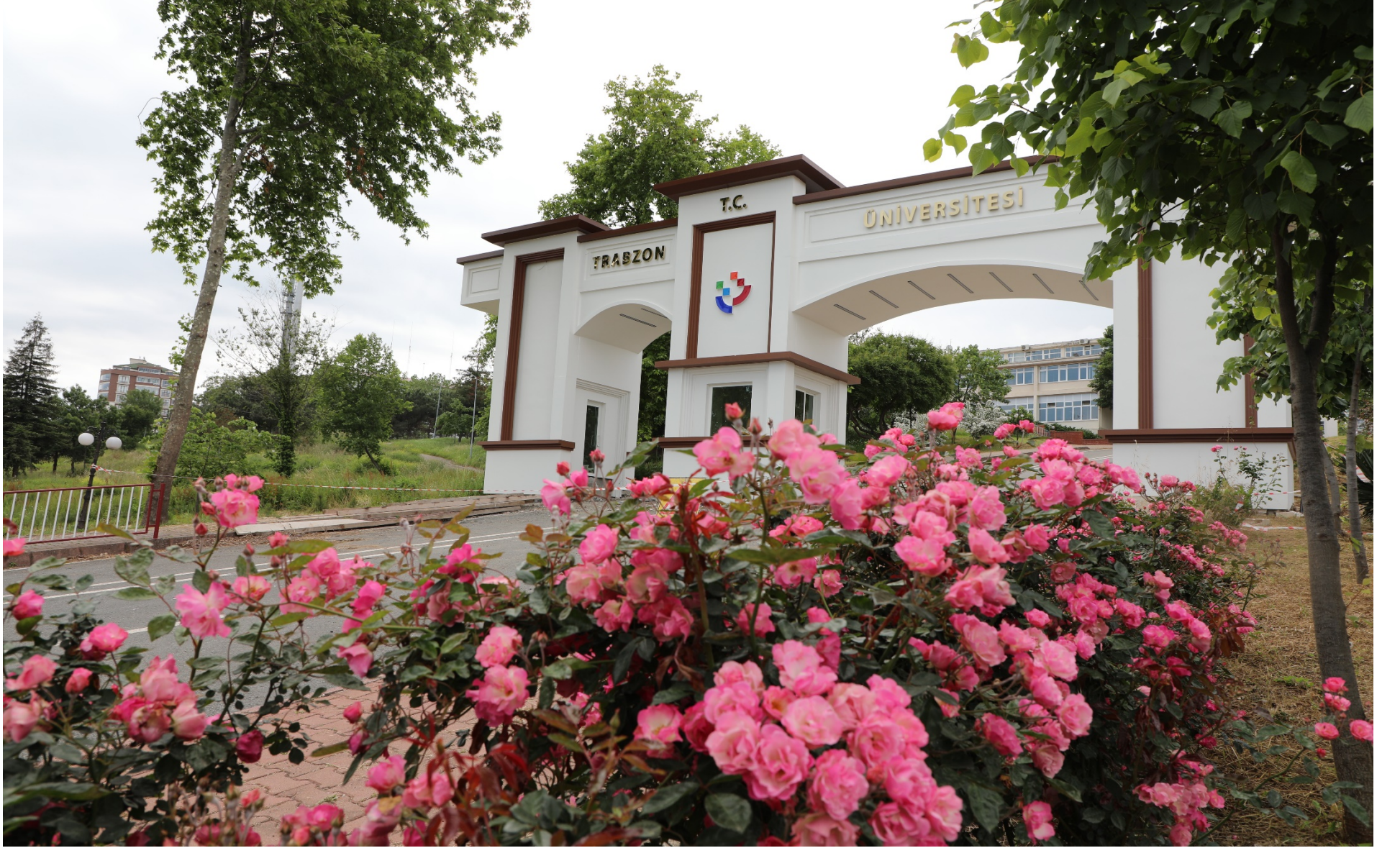
Resim 1 : Trabzon Üniversitesi Girişi