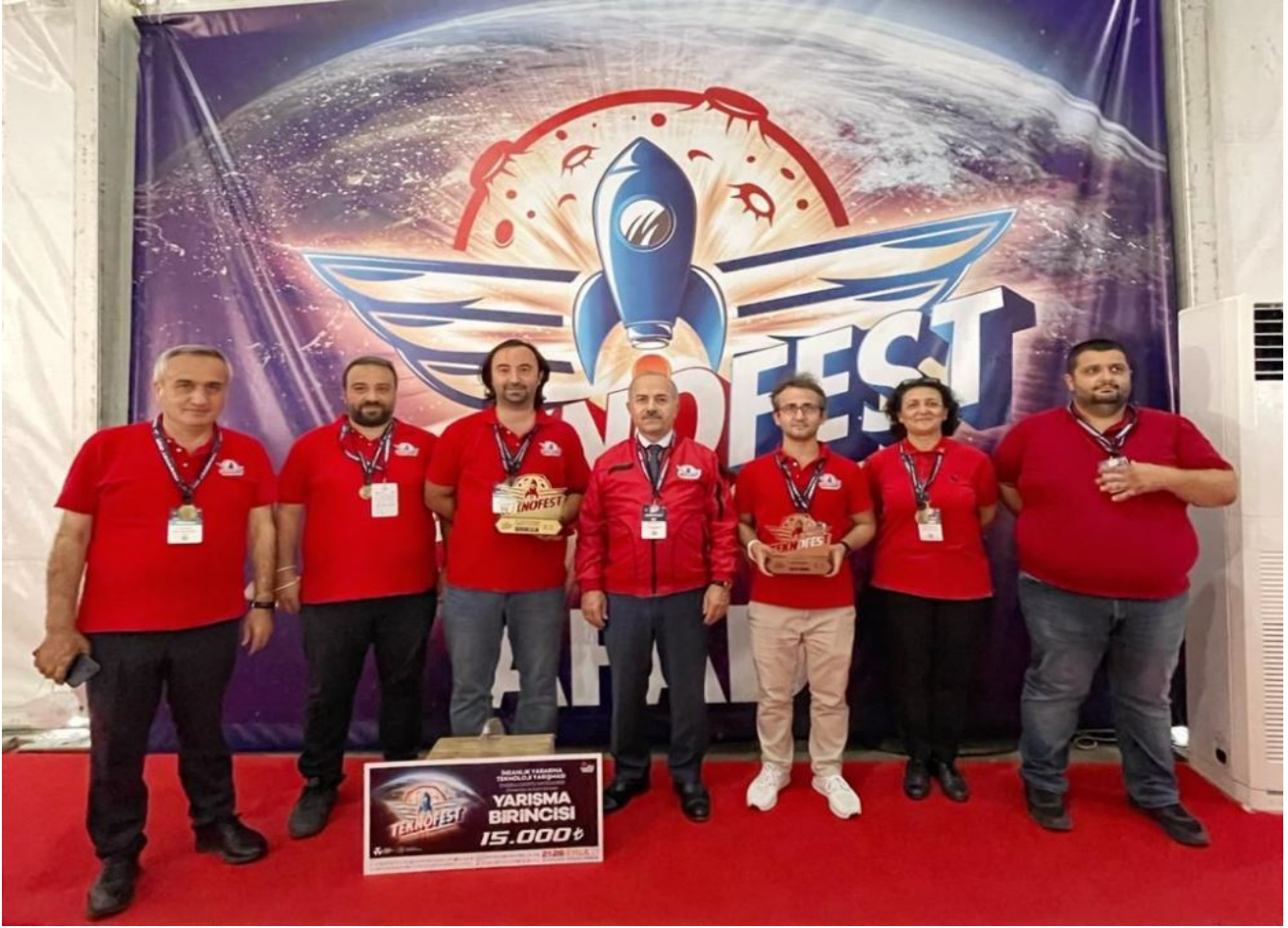
Resim 14: Üniversitemiz Teknofes'te Üniversitemize Teknofest'de İki Ödül kazandı.