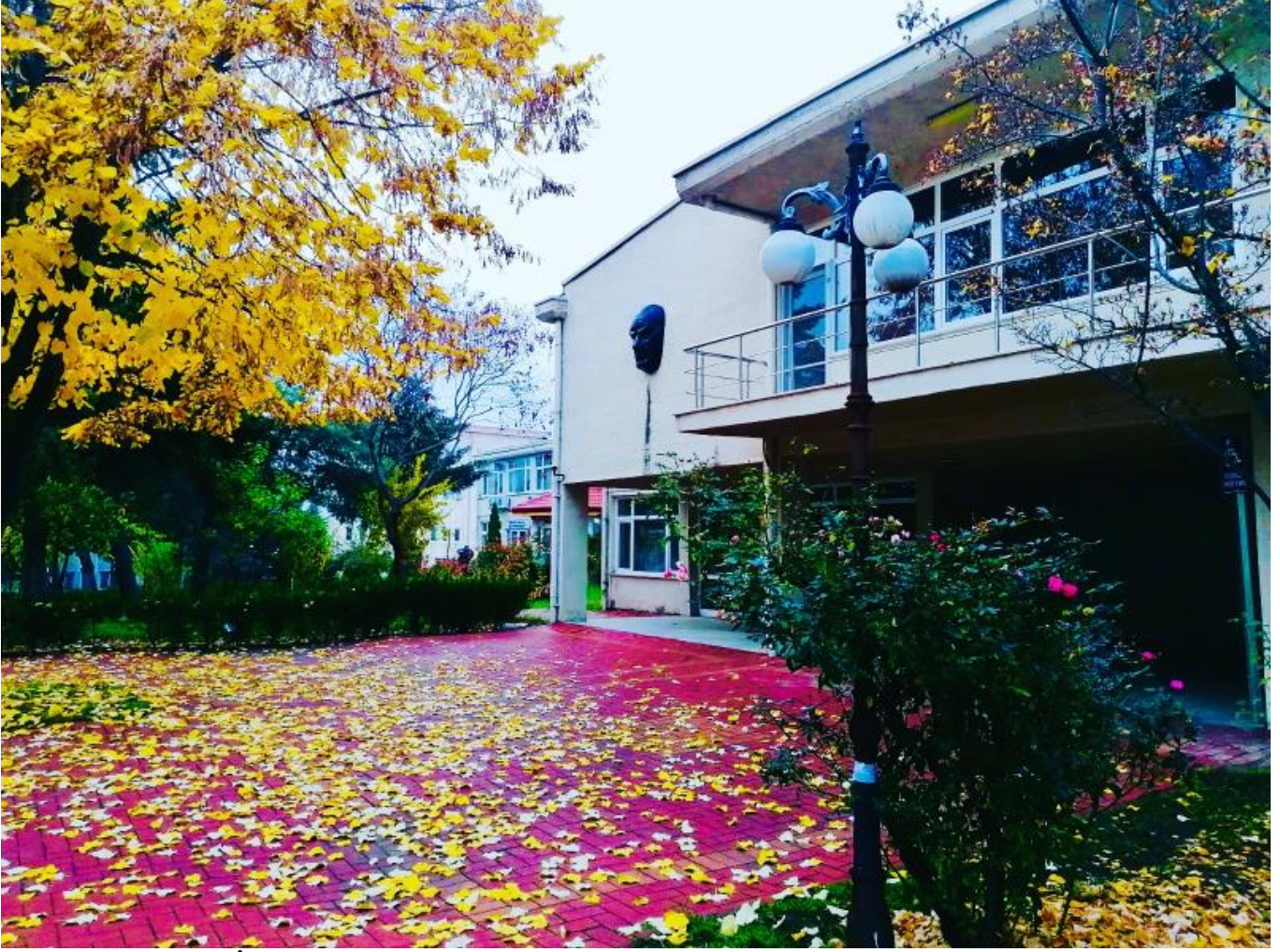
Resim 3. Kampüs İçi Bir Bölüm