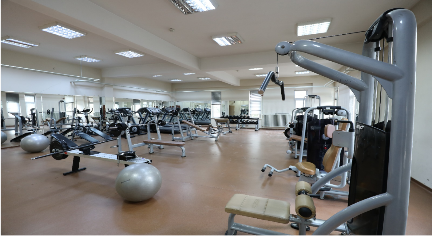
Resim 11: Fitness Salonu