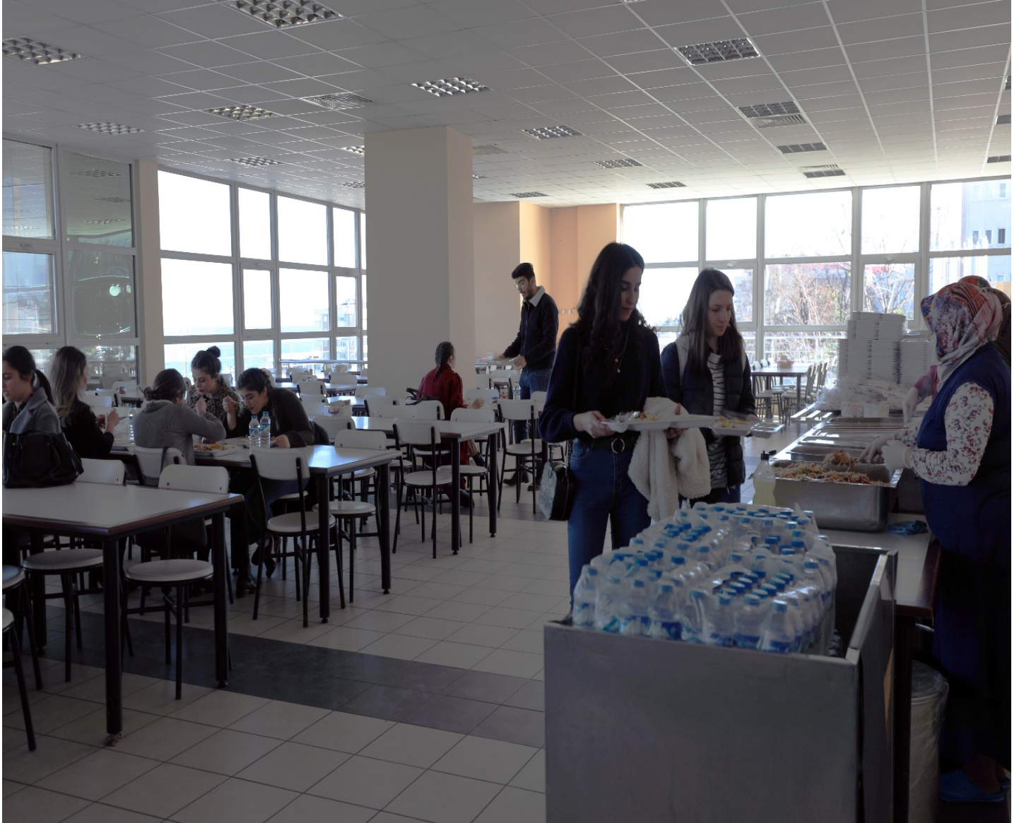
Resim 4: Trabzon Üniversitesi Yemekhanesi