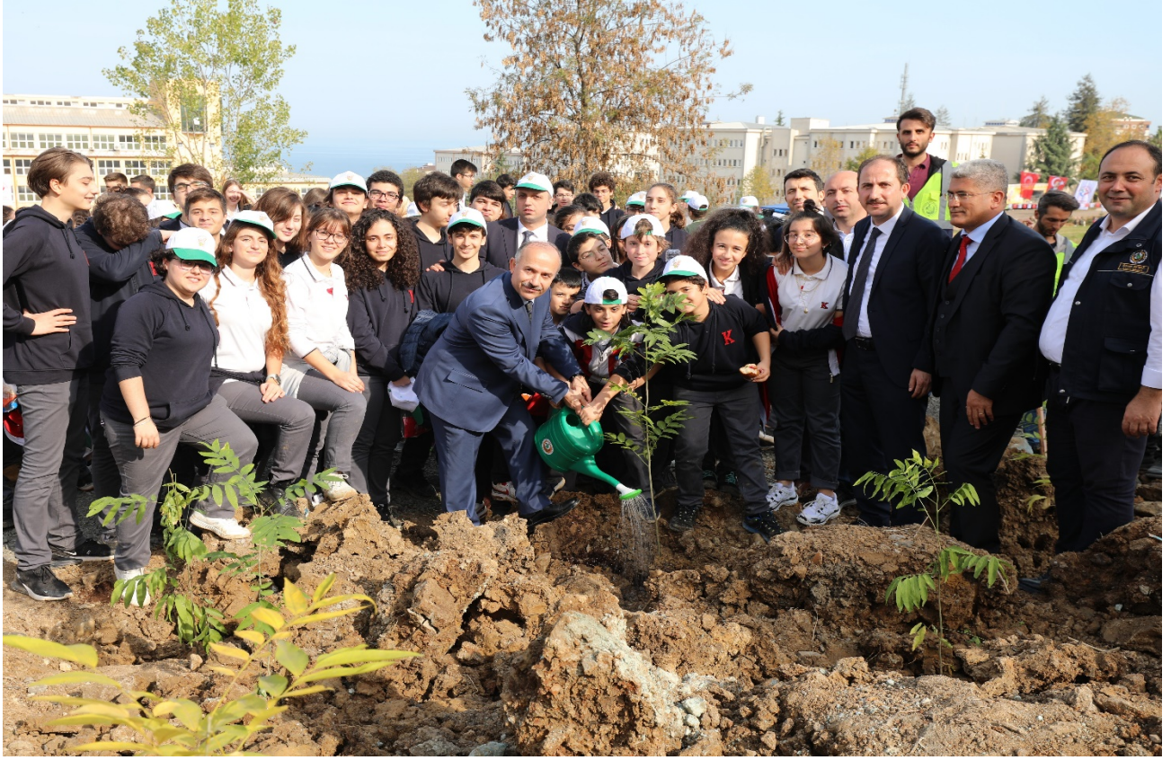
Resim 10: Aaçlandırma Etkinliđi