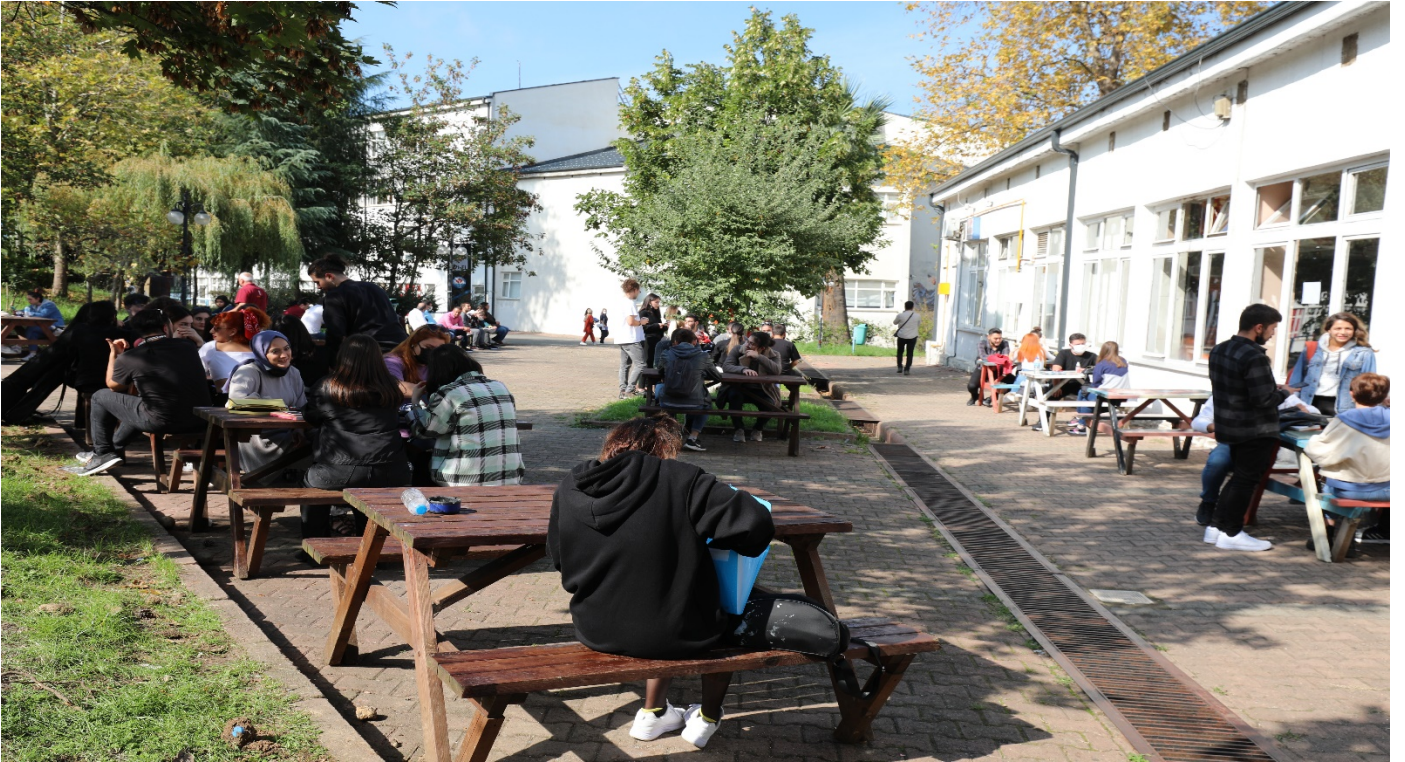
Resim 8: Öğrenci Kantini 2