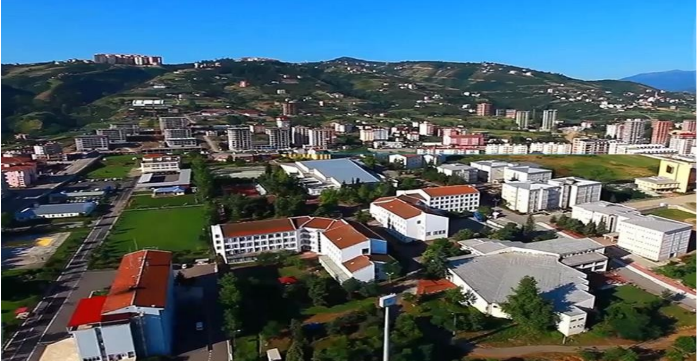
Resim 2. Fatih Yerleşkesi