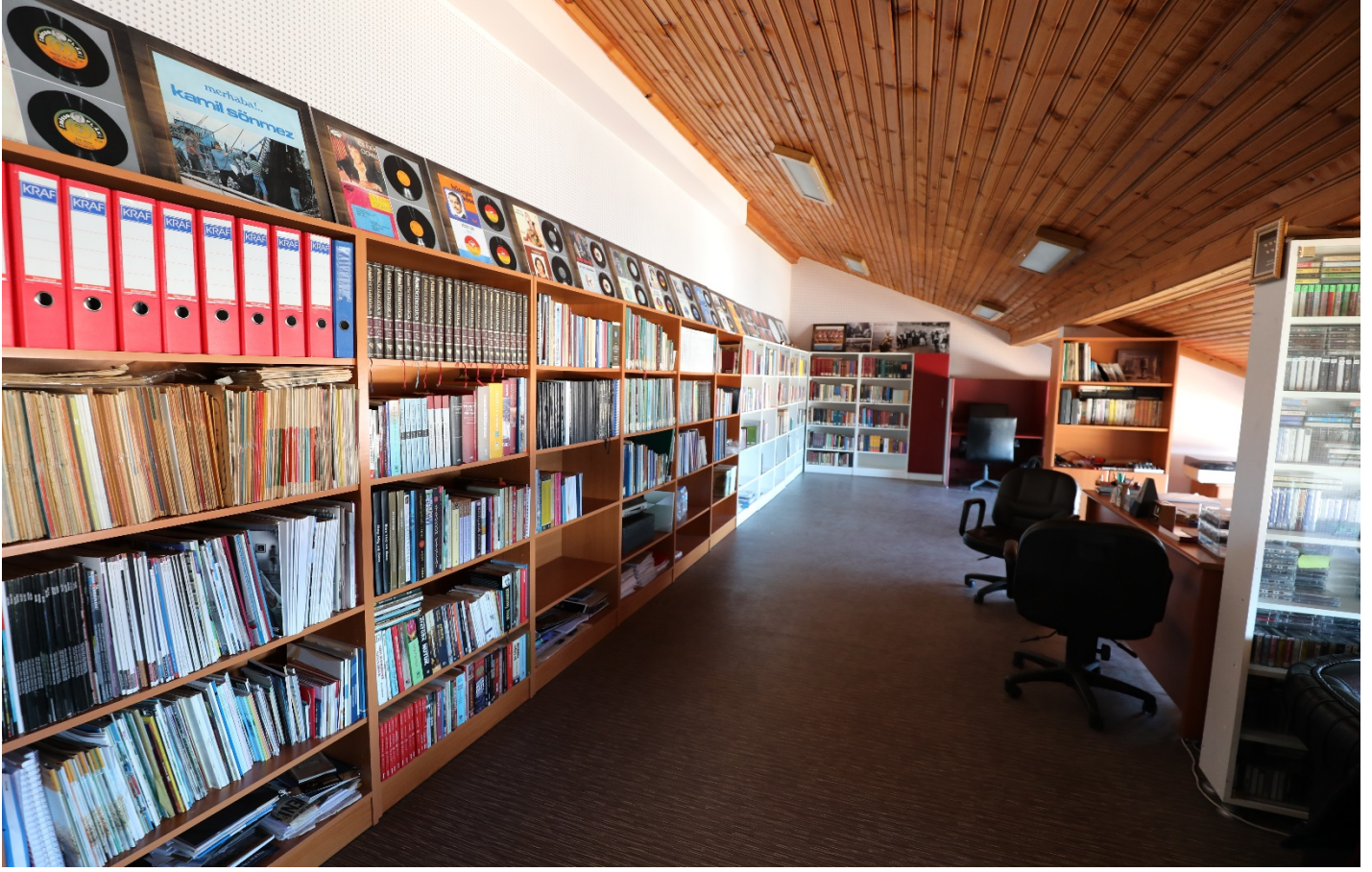
Resim 9 : Trabzon Üniversitesi Kütüphanesinden Bir Bölüm.