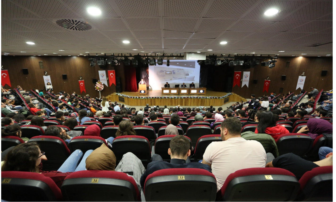
Resim 5- Trabzon Üniversitesi Toplantı Salonu