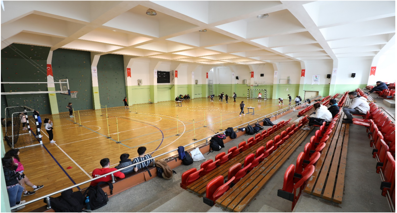
Resim 6: Trabzon Üniversitesi Kapalı Spor Salonu