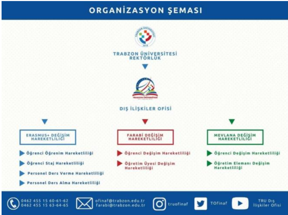
Resim 1. TRU Dış İlişkiler Kurum Koordinatörlüğü Organizasyon Şeması

Dış İlişkiler Kurum Koordinatörlüğü bünyesinde Erasmus+ Değişim Programı Hareketliliği, Farabi Değişim Programı Hareketliliği ve Mevlâna Değişim Programı Hareketliliği olmak üzere üç ayrı değişim programı hareketliliği bulunmaktadır. Bu hareketliliklere ve alt basamaklara yönelik organizasyon şeması oluşturulmuş ve Resim 1’de sunulmuştur. Ayrıca bu bilgiye https://ofinaf.trabzon.edu.tr/S/3367/organizasyon-semasi linki üzerinden de ulaşabilmek mümkündür.